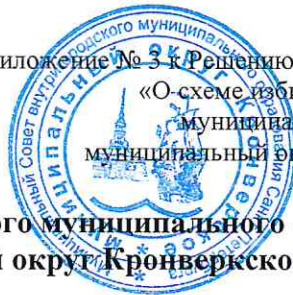
Схема избирательных округов внутригородского муниципального образования Санкт-Петербурга муниципальный округ Кронверкское